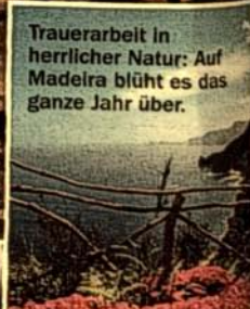
Trauerarbeit in herrlicher Natur: Auf Madeira blüht es das ganze Jahr über.