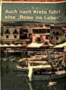
Auch nach Kreta führt eine „Reise ins Leben“.