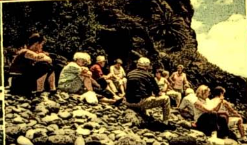
Gedankenaustausch am Strand: Teilnehmer einer Trauerreise auf Madeira