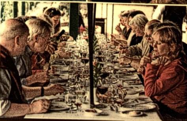
Unten: Die Abende klingen in geselliger Runde aus.