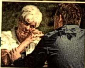
Links: Trauerbegleiter helfen den Reiset Teilnehmern, ihren Schmerz zu verarbeiten.